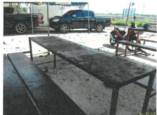
ที่พักผ่อนสำหรับคนงาน