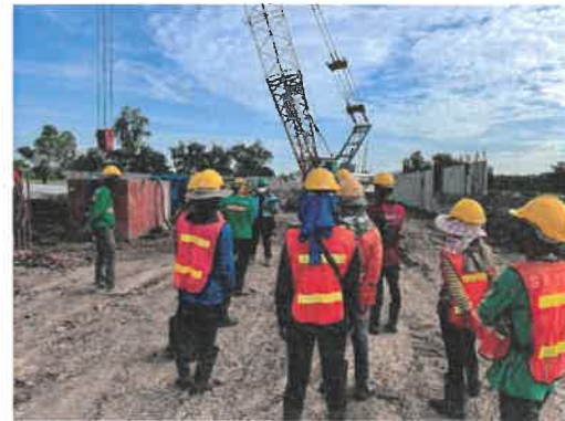
ภาพที่ 2.2-16 อุปกรณ์ป้องกันส่วนบุคคล