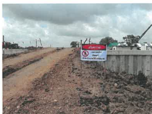
อันตรายเขตก่อสร้าง