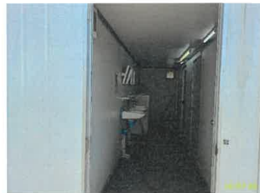
ภาพที่ 2.2-6 ห้องสุขา