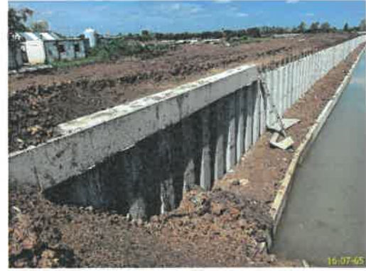
ภาพที่ 2.2-13 คันป้องกันน้ำท่วม