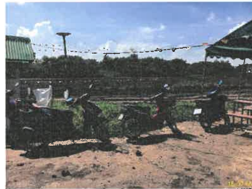
ภาพที่ 2.2-8 พื้นที่จอดรถผู้รับเหมา