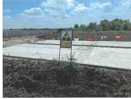
ระวังหลุมลึก