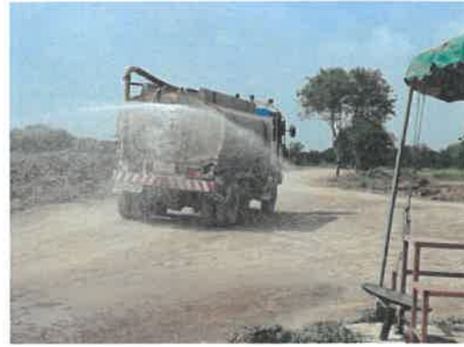
ภาพที่ 2.2-3 ฉีดพรมพื้นที่ก่อสร้าง