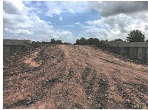
ภาพที่ 2.2-1 ทางสาธารณะที่ผ่านพื้นที่โครงการ