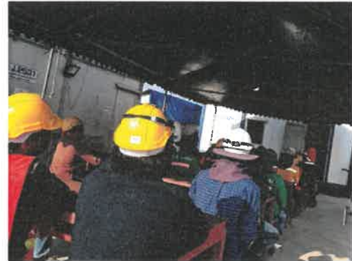
ภาพที่ 2.2-15 (ต่อ) อบรมก่อนปฏิบัติงาน