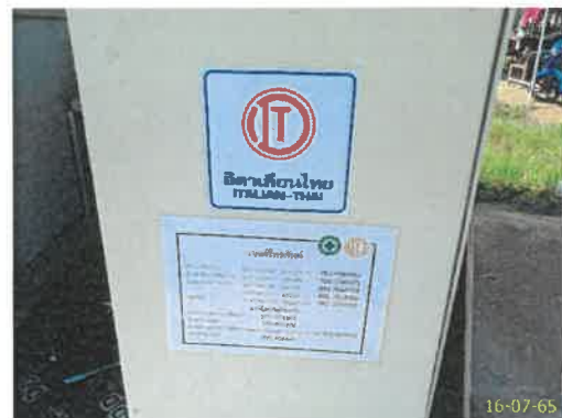
ป้ายความปลอดภัย