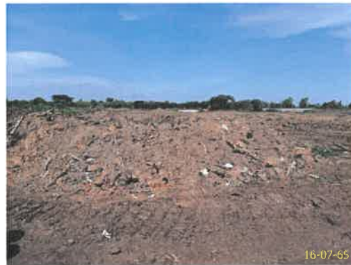
พื้นที่ขยะรวม