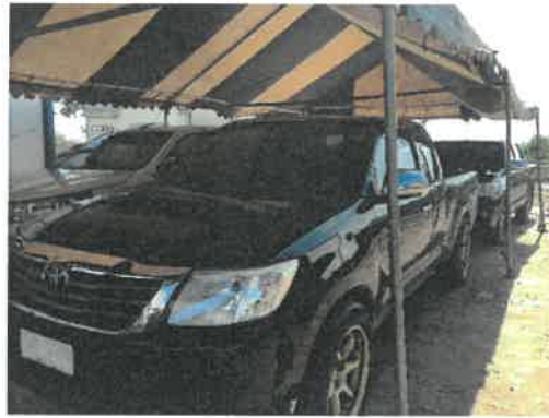
รถรับส่งผู้บาดเจ็บ