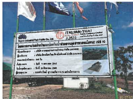
ป้ายชื่อโครงการ