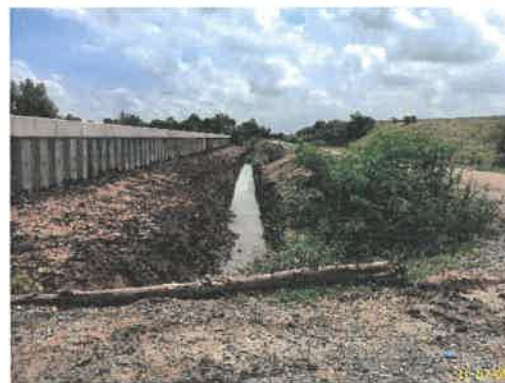
รางระบายน้ำฝนภายนอกโครงการ