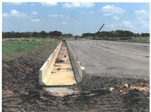
ถนนสายหลักพื้นที่โครงการ ภาพที่ 2.2-2 พื้นที่ก่อสร้างโครงการ