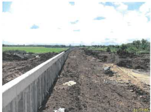
คันดินรอบพื้นที่โครงการ