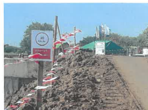
ป้ายจำกัดความเร็ว