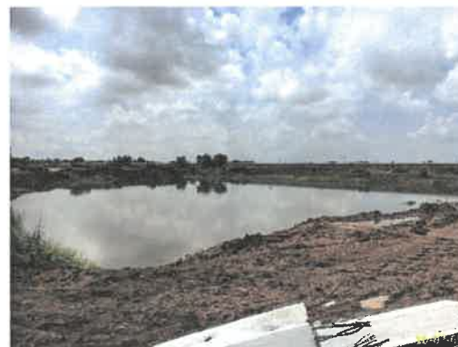
บ่อดักตะกอน