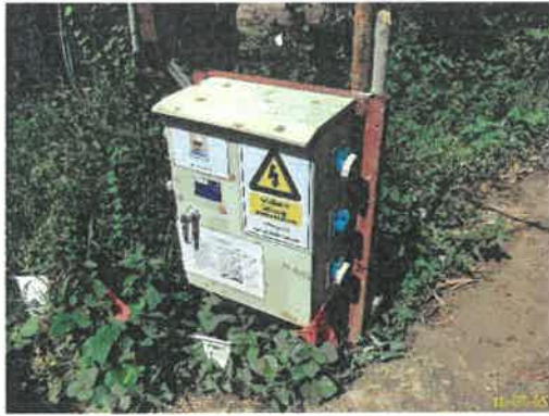
อันตรายไฟฟ้าแรงสูง