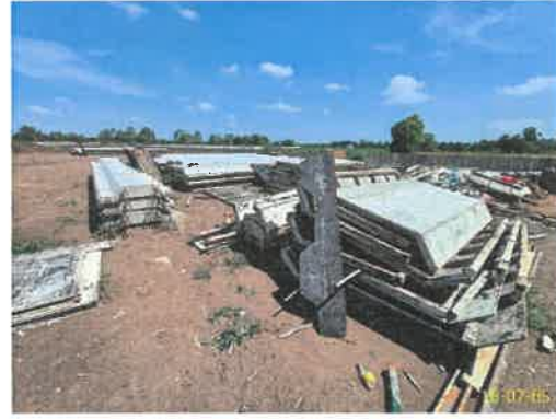
ภาพที่ 2.2-7 สถานที่กองวัสดุ