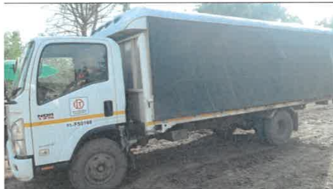
ภาพที่ 2.2-4 รถขนส่งพื้นที่โครงการ