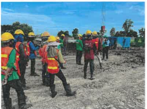
ภาพที่ 2.2-15 อบรมก่อนปฏิบัติงาน