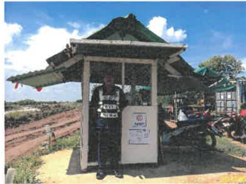
ภาพที่ 2.2-9 รูปก.พื้นที่โครงการ