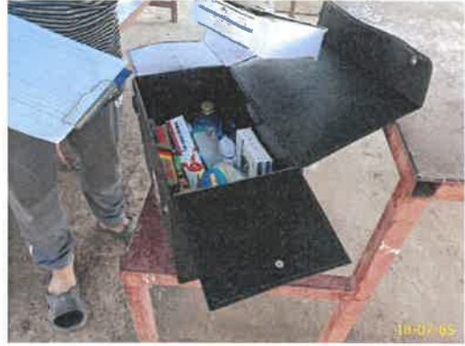
อุปกรณ์ปฐมพยาบาล