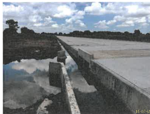
รางระบายน้ำฝนภายในโครงการ