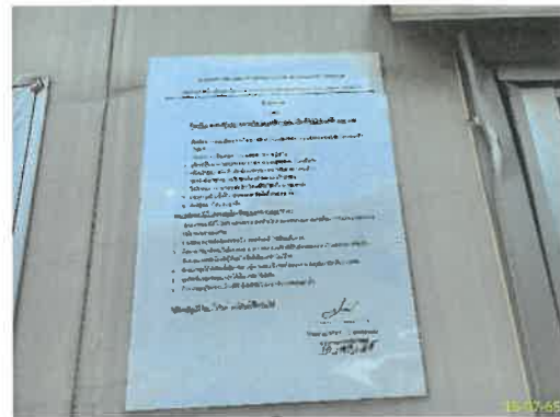
ภาพที่ 2.2-5 กฎระเบียบผู้มาติดต่อ