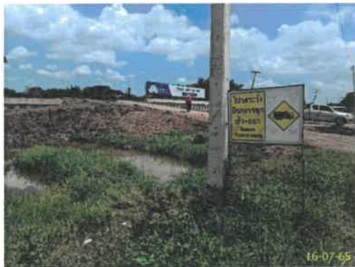
ระวังรถบรรทุกเข้า-ออก